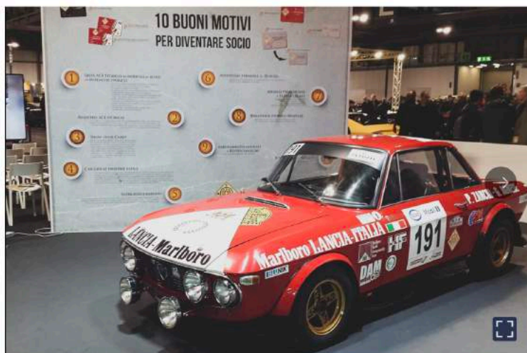
ACI STORICO A MILANO AUTOCLASSICA 2018