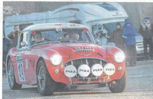
Malgré son demi-siècle, l'Austin Healey demeure une attraction sur les routes du Monte-Carlo.

Enfin, si l'ensemble des routes resteront ouvertes à la circulation et que les équipages doivent impérativement respecter le code de la route, les automobilistes sont invités à la plus grande prudence, surtout s'ils empruntent à contresens la vallée du Doux et le secteur de Lamastre, Gihoc-sur-Ormeze et Plats.