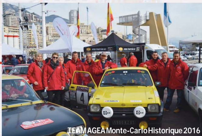
TEAM AGEA Monte-Carlo Historique 2016

In 2017, TEAM AGEA enters 9 passionate crews, most of them experienced, which should allow for interesting results. During eight days, the enthusiasm for RALLYE MONTE-CARLO HISTORIQUE will never fail along the roads, at the check points, in the parc fermés and the host-cities. TEAM AGEA will make sure its presence is noticed in all strategic points along the route. This Sunday January 29 , from 11:00 am onwards, the walled city of SISTERON (04), at the door of Provence, with its citadel at the top of a rock, dominating the Durance river, Team Agea will organize a warm welcome for over 300 crews, thanks to the help of the Town Hall, the Tourist Office, the Automobile Club des Alpes, the Laragnais Auto Sport and the Association Sportive Automobile des Alpes. There will be dozens of famous « tourtons » coming from the Champsaur area, Sébastien Ogier's birthplace north of Gap, on Place de la République, as well as a Road Safety event for spectators.