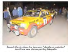
Renault Classic, aligne les femmes "planches à roulettes" dont l'une sera pilotée par Guy Fréquelin.