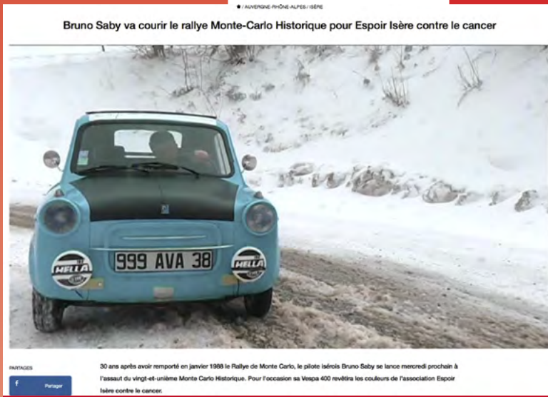
Bruno Saby va courir le rallye Monte-Carlo Historique pour Espoir Isère contre le cancer

30 ans après avoir remporté en janvier 1988 le Rallye de Monte-Carlo, le pilote isérois Bruno Saby se lance mercredi prochain à l'assaut du vingt-et-unième Monte-Carlo Historique. Pour l'occasion sa Vespa 400 revêtira les couleurs de l'association Espoir Isère contre le cancer.