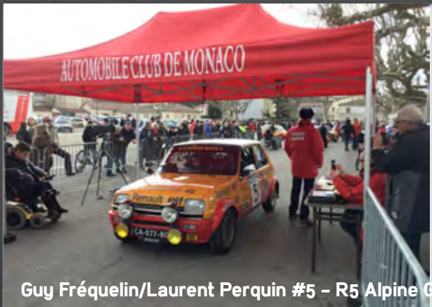
Guy Fréquelin/Laurent Perquin #5 - R5 Alpine Gr2