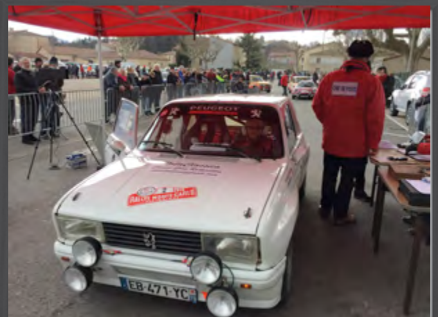
Carlos Tavares/Pauline Schoofs #2 - Peugeot 104 ZS