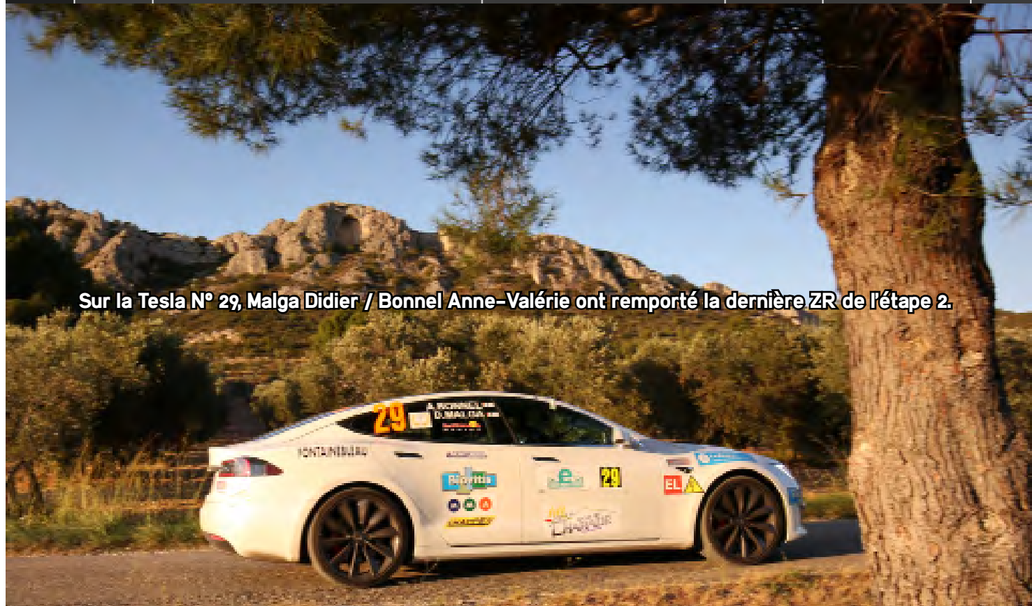
Sur la Tesla N° 29, Malga Didier / Bonnel Anne-Valérie ont remporté la dernière ZR de l'étape 2.