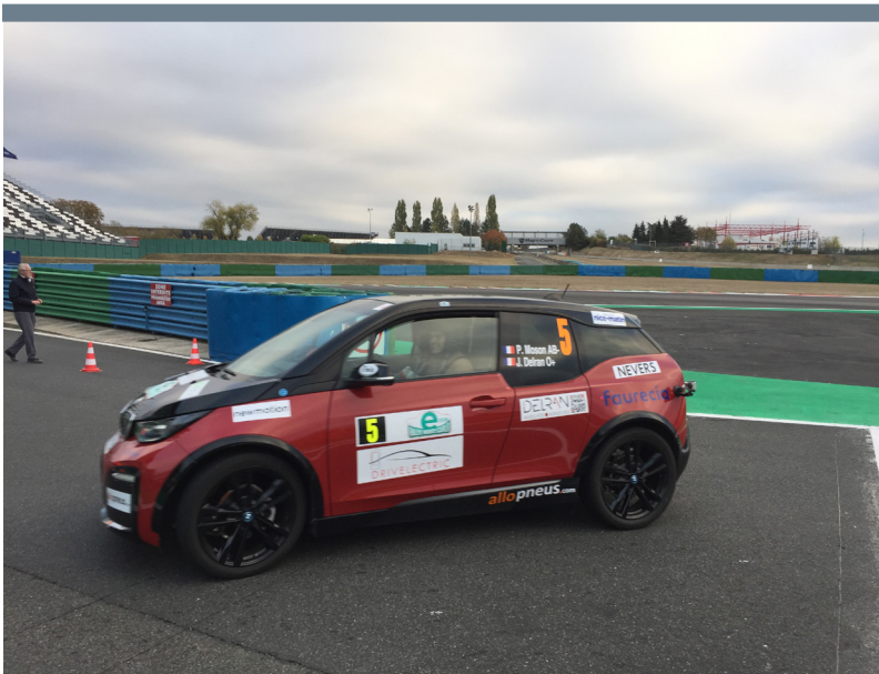
BMW I3 #5 Piotr Moson et Jérémie Delran.

AVIS aux USAGERS eRallye Monte-Carlo EPREUVE de REGULARITE Les concurrents emprunteront cet itinéraire le : VENDREDI 26 Octobre 2018 de 14 h.00 à 17 h.00