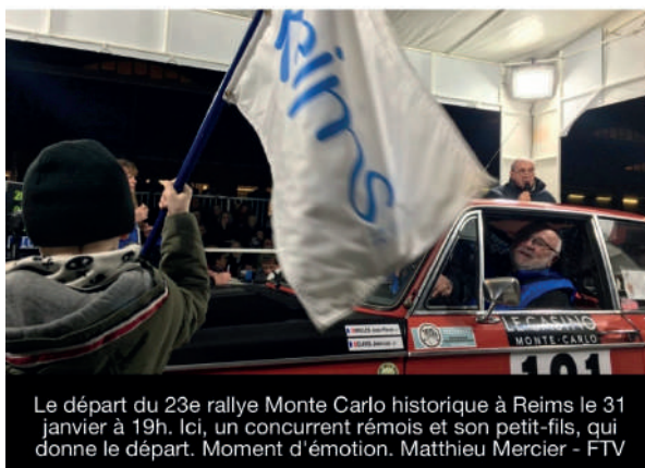
Le départ du 23e rallye Monte Carlo historique à Reims le 31 janvier à 19h. Ici, un concurrent rémois et son petit-fils, qui donne le départ. Moment d'émotion.