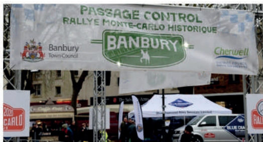
Rallye Monte Carlo Historique, Banbury. NNL-200130-170621009