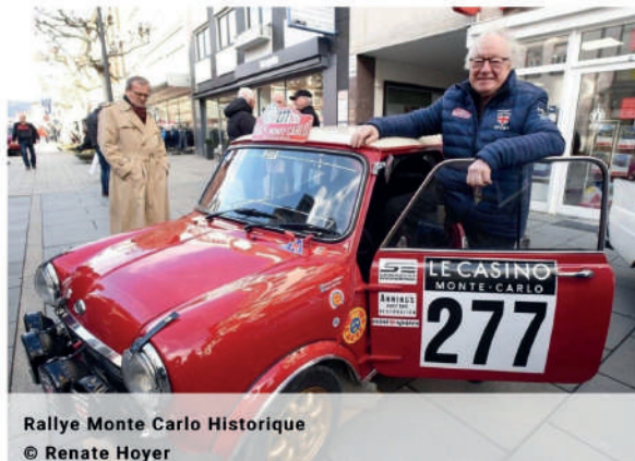
Rallye Monte Carlo Historique