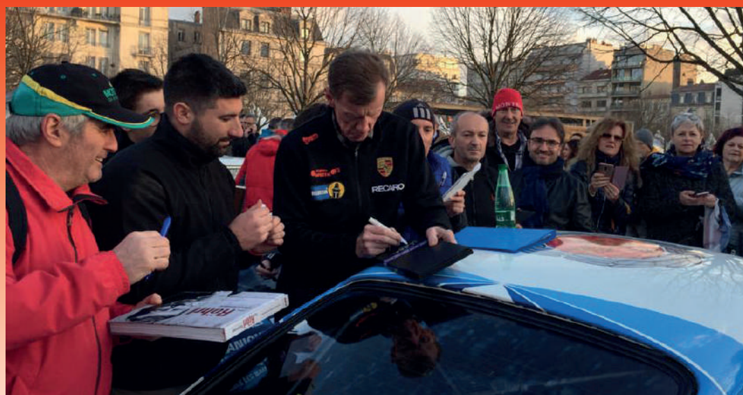
Les années passent, mais W. Rohrl reste un chouchou des fans de rallyes