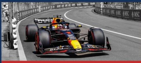
04 - 07 juin FORMULA 1 GRAND PRIX DE MONACO 83 e EDITION