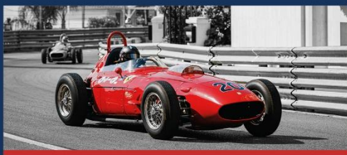
24-26 avril GRAND PRIX DE MONACO HISTORIQUE 15 e EDITION