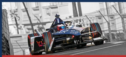
16 - 17 mai * MONACO E-PRIX 10 e & 11 e EDITIONS