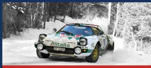
29 janvier - 07 février RALLYE MONTE-CARLO HISTORIQUE 28 e EDITION