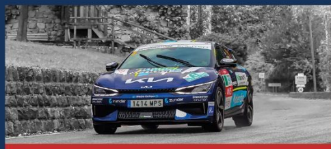
14 - 17 octobre * E-RALLYE MONTE-CARLO 26 e EDITION