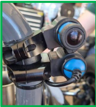
Camera crayon autorisée / Permitted Bullet Camera