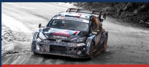
19 - 25 janvier RALLYE MONTE-CARLO 94 e EDITION