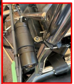
Exemple de caméra et support non autorisées / Example of prohibited Camera & Support